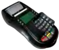
Optimum M 4240